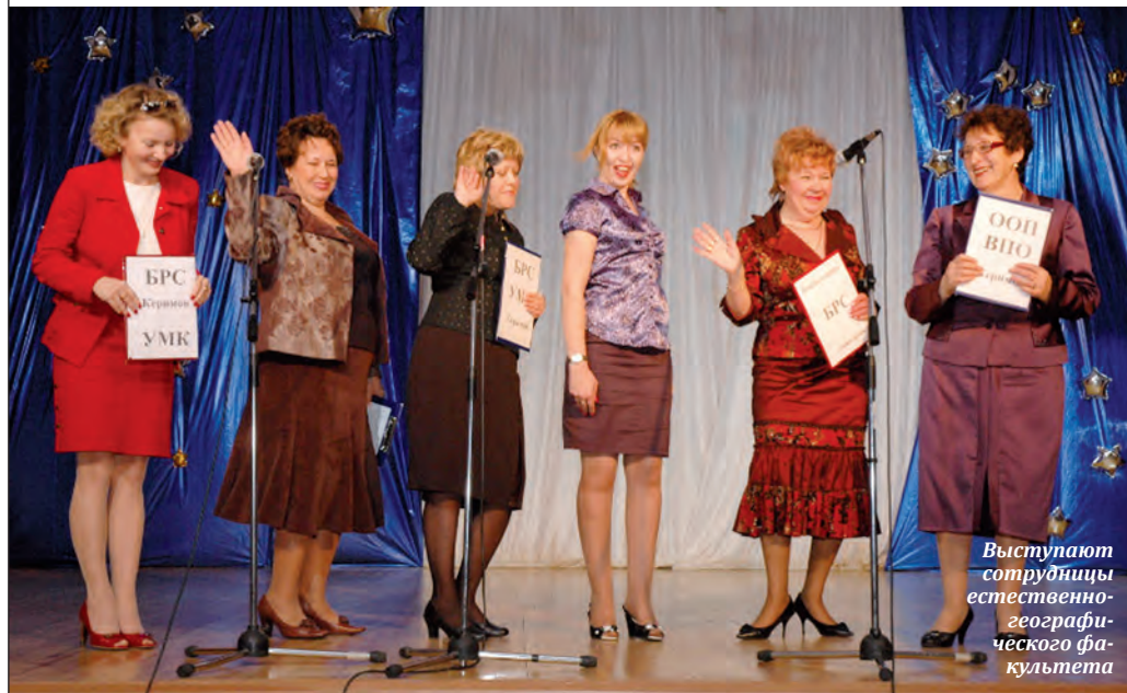
Выступают сотрудницы естественно-географического факультета