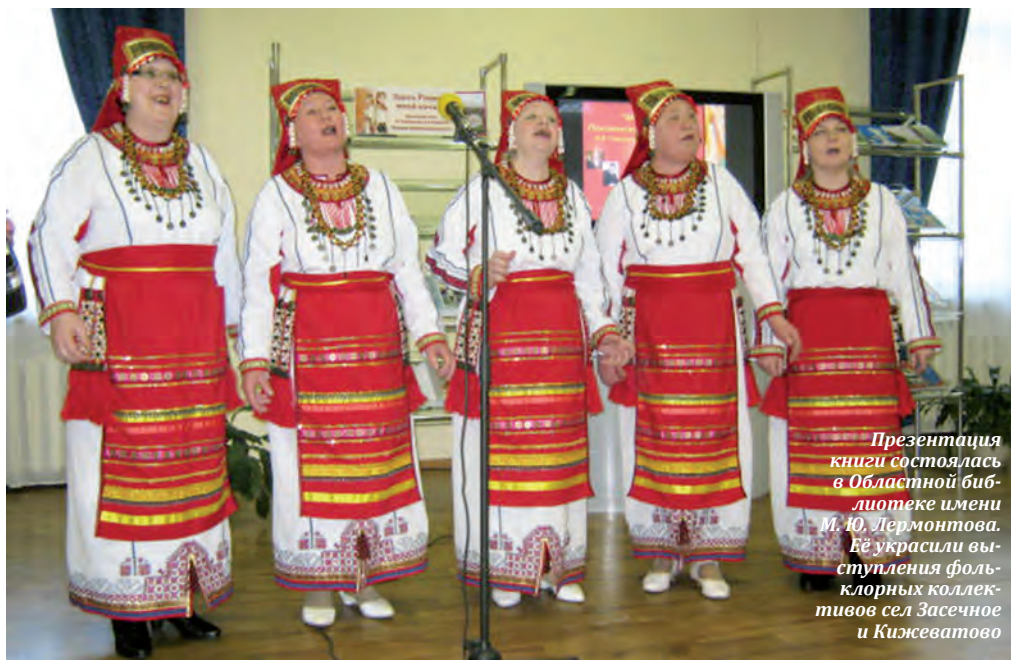
Презентация книги состоялась в Областной библиотеке имени М. Ю. Лермонтова. Её украсили выступления фольклорных коллективов сёл Засечное и Кижеватово