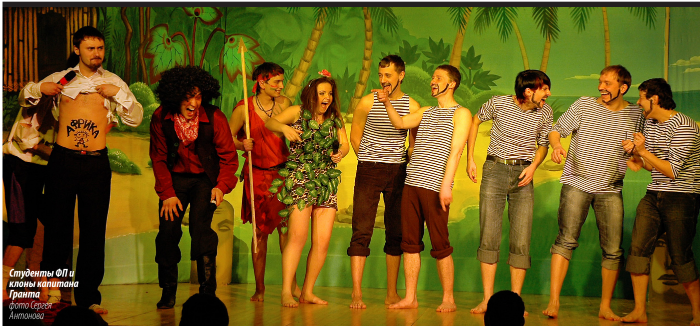
Студенты ФП и клоны капитана Гранта

Мысли вслух: Кто бы мог подумать, что капитан Грант — ни есть капитан Грант, то есть, конечно, он — это он, но то в романе Жюль Верна, а у студентов — родной и единственный отец родом из деканата, который при случае и похвалит, и поругает, и стипендией наградит.