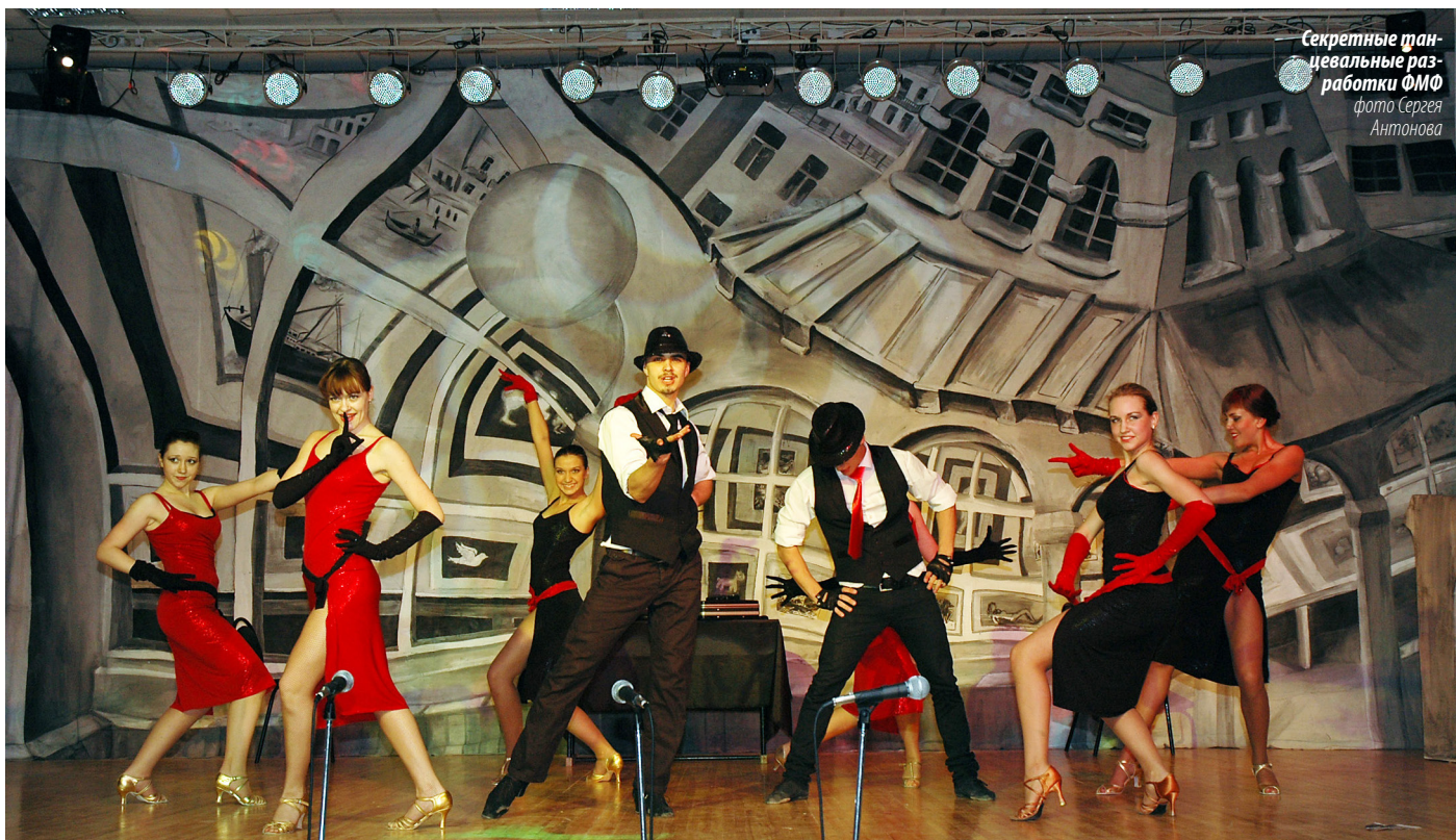
Секретные танцевальные разработки ФМФ