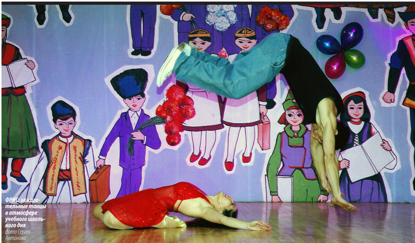
ФРИС зажигательные танцы в атмосфере учебного школьного дня