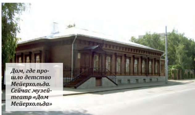
Дом, где прошло детство Мейерхольда. Сейчас музей-театр «Дом Мейерхольда»