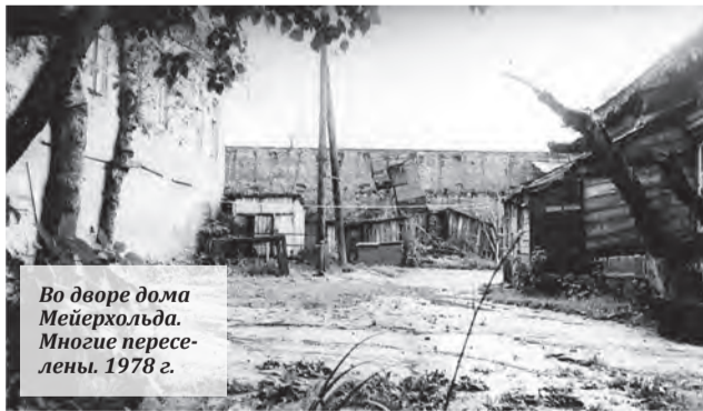
Во дворе дома Мейерхольда. Многие переселены. 1978 г.