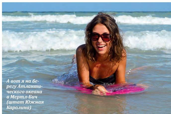
А вот я на берегу Атлантического океана в Мертл-Бич (штат Южная Каролина)

Человек без мечты не может существовать осмысленно. И, на мой взгляд, одно из самых лучших стремлений – желание путешествовать. Как много возможностей, впечатлений теряет человек, просто сидя дома в привычной обстановке